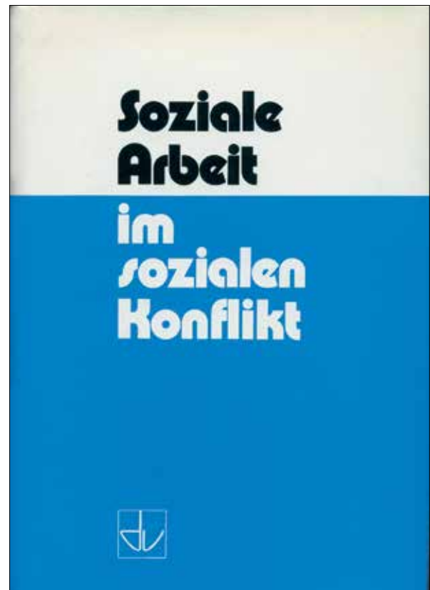
Dokumentation des Deutschen Fürsorgetags 1973

116-seitige Publikation wurde als Einzelheft zu 5,00 Mark verkauft, während normalerweise die Hefte nur an DV-Mitglieder oder im Abonnement abgegeben wurden.