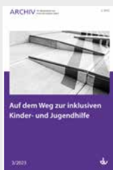
Archiv Nr. 3/2023 Auf dem Weg zur inklusiven Kinder- und Jugendhilfe