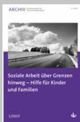
Archiv Nr. 1/2023 Soziale Arbeit über Grenzen hinweg – Hilfe für Kinder und Familien