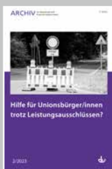
Archiv Nr. 2/2023 Hilfe für Unionsbürger/innen trotz Leistungsausschlüssen?