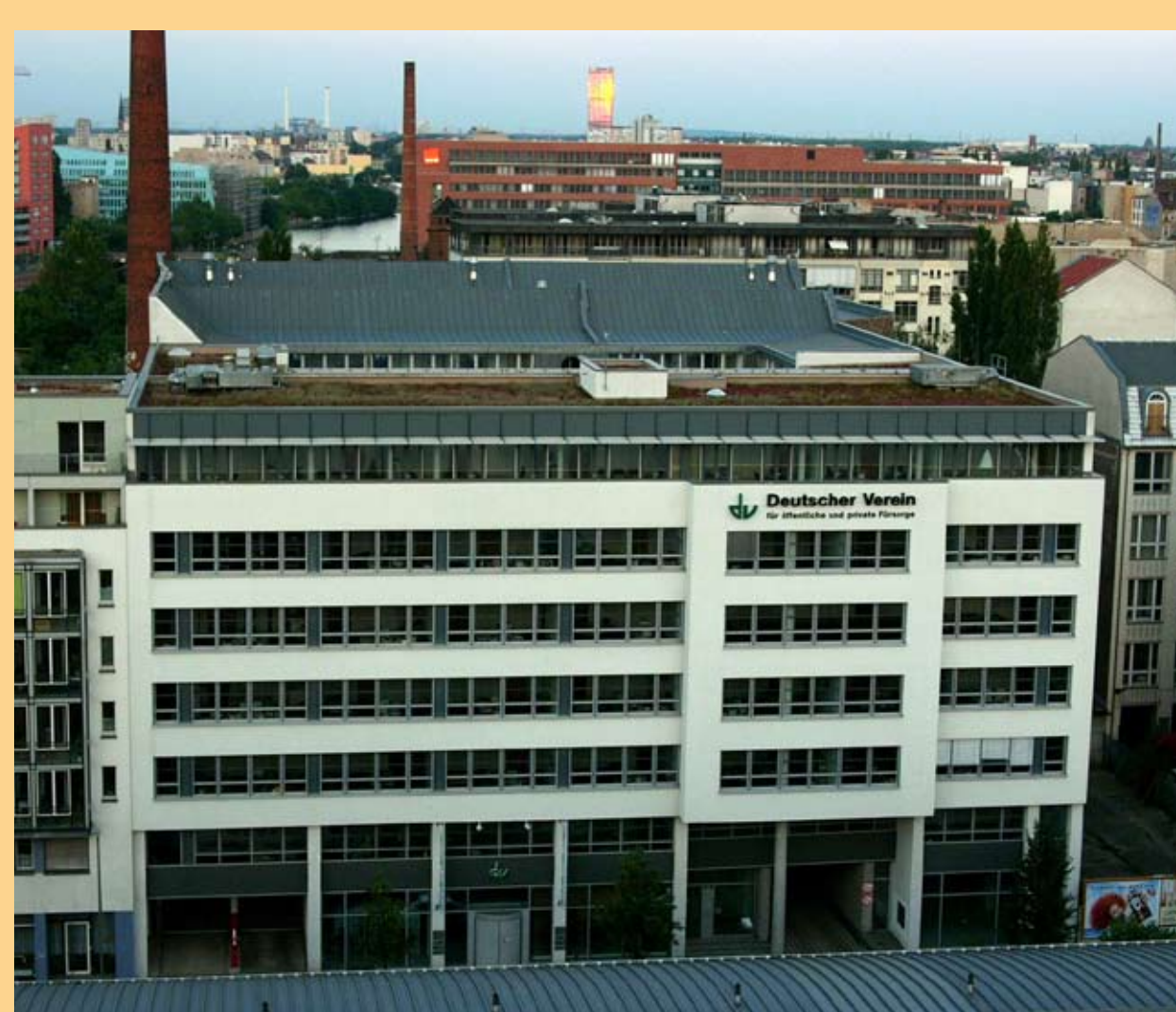
Sitz des DV seit 2004 in der Michaelkirchstr. 17/18 in Berlin.