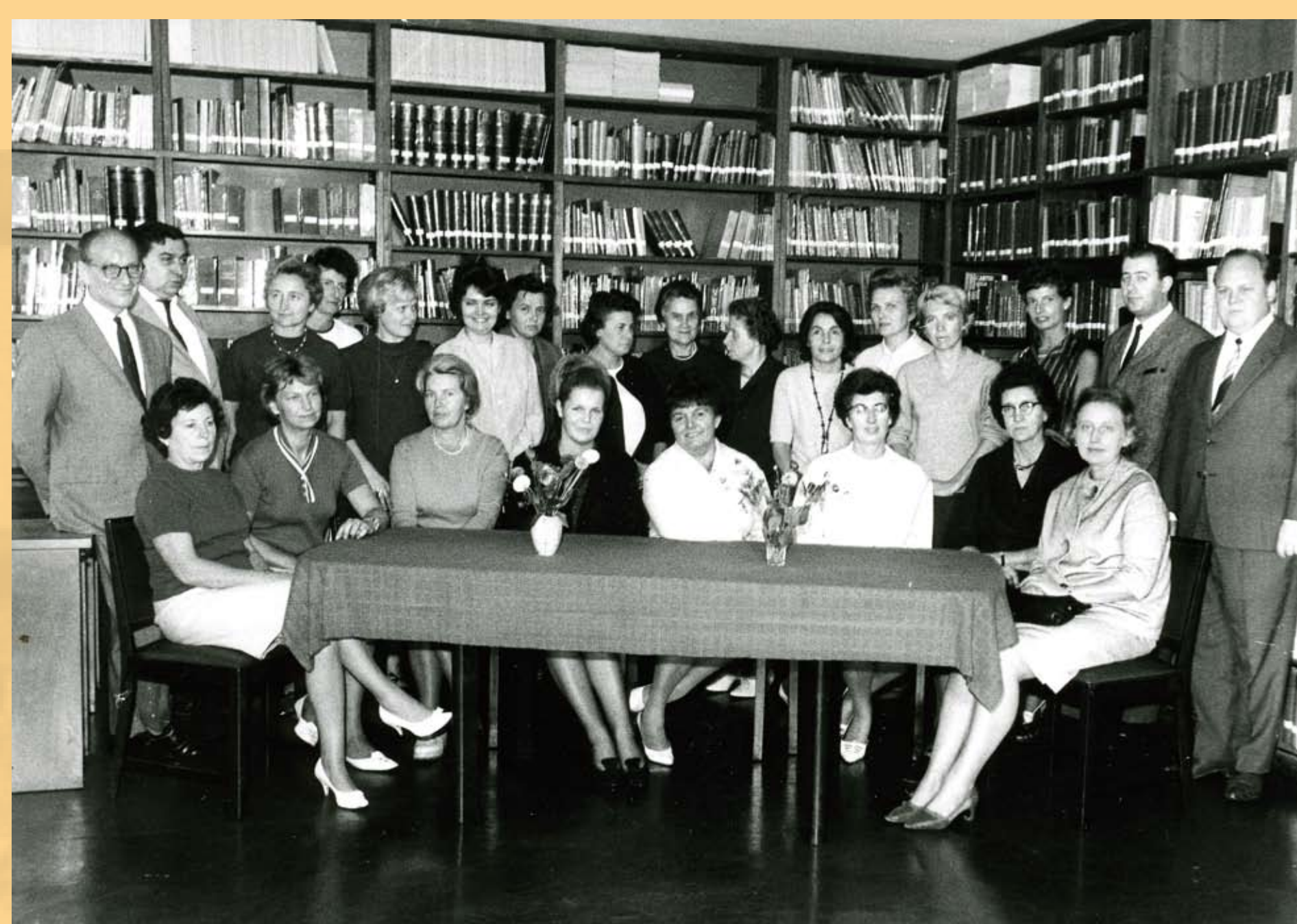
Mitarbeiter/innen des DV in der Bibliothek der Geschäftsstelle in der Beethovenstr. 61, Frankfurt/M.